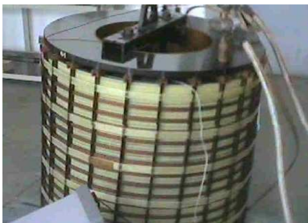
катушка перед высушиванием «DC» током